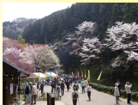
サクラの季節の弘川寺歴史と文化の森

[海辺]お台場で海苔づくり～人工海浜での環境学習からコミュニティとふるさと創出～